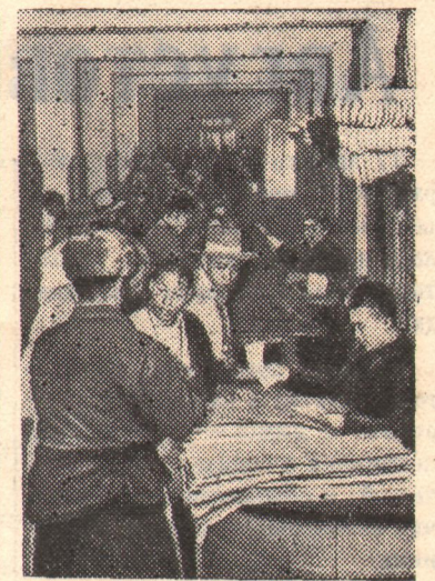
Тибетская автономная область в Китайской Народной Республике. В государственном промтоварном магазине в городе Чамдо.

После национализации компании количество судов, проходя-